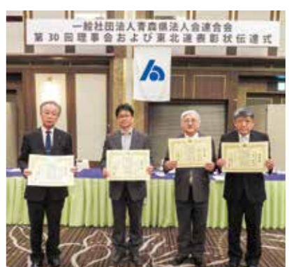
東北連表彰状伝達

(4)定時総会の招集に係る事項については、また、理事会終了後、東北連役員功労表彰状伝達式を行った。(東北連功労者は慶祝欄参照)