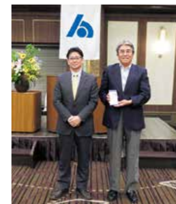
納税表彰記念品贈呈