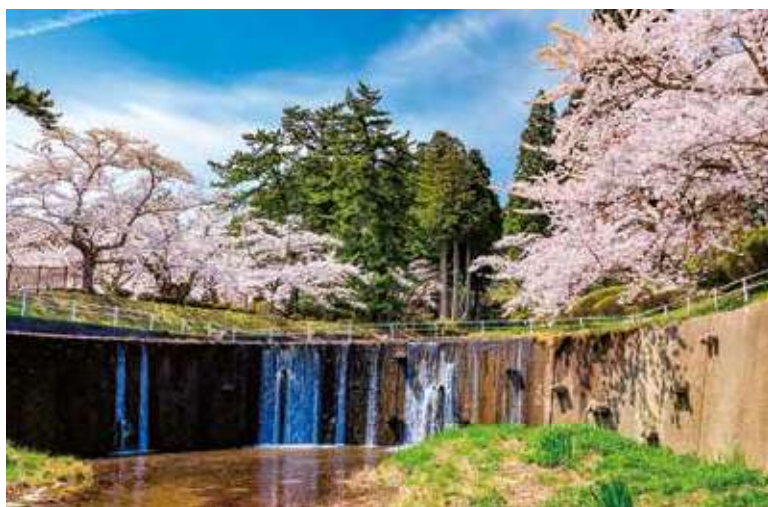
水源池公園(むつ市)